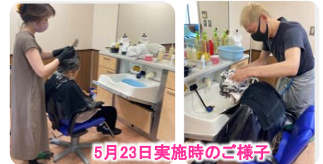
5月23日実施時のご様子